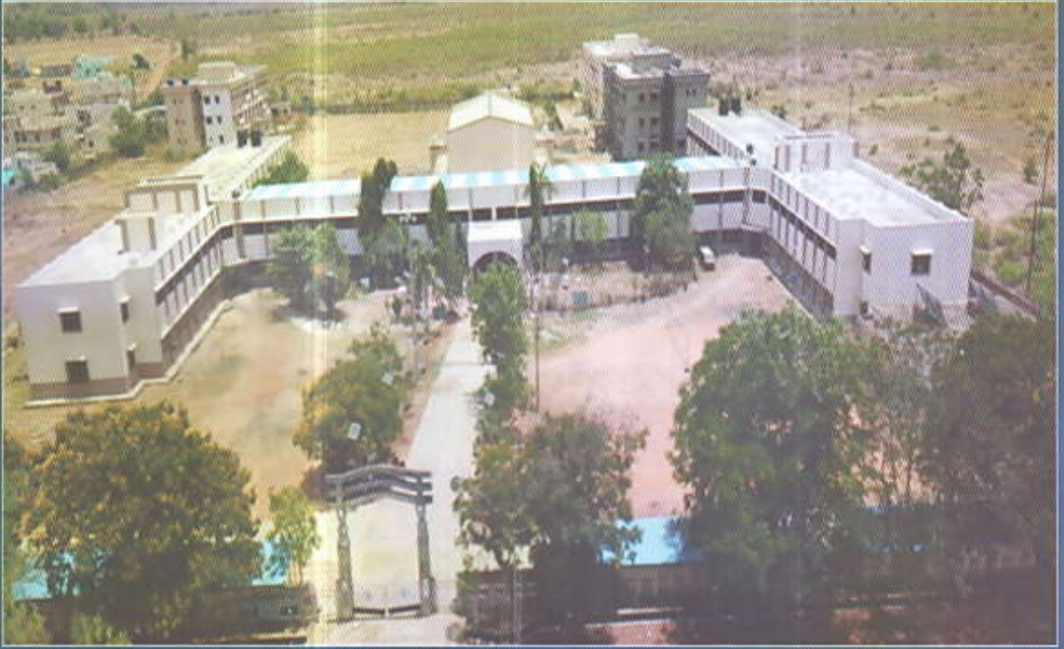
Gopal Computer, Gadchiroli 9873089391

Phone / Fax : 07132-233539 Email : pringscgadchiroli@gmail.com | Website : www.gscgadchiroli.ac.in