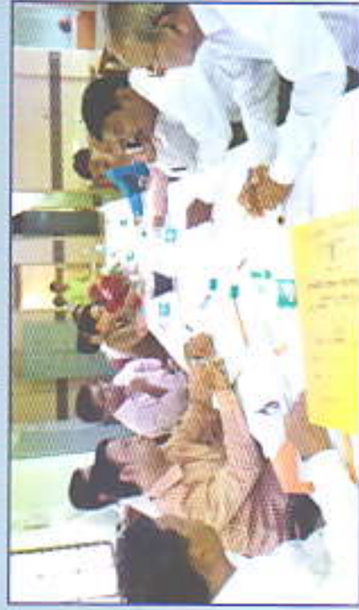
महाविद्यालयीन विकास समिती