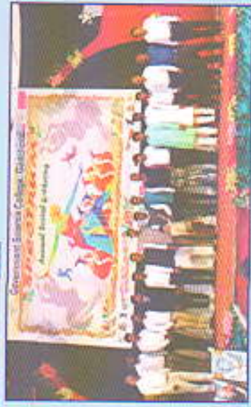
स्पेक्ट्रम - २०१९ चा कार्यक्रम सौहार्दळात उपस्थित शिक्षक युंदा सदस्यानी विषयाची