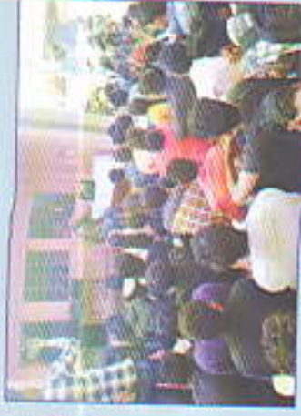
शिबीर व्याख्यानाचे आयोजन