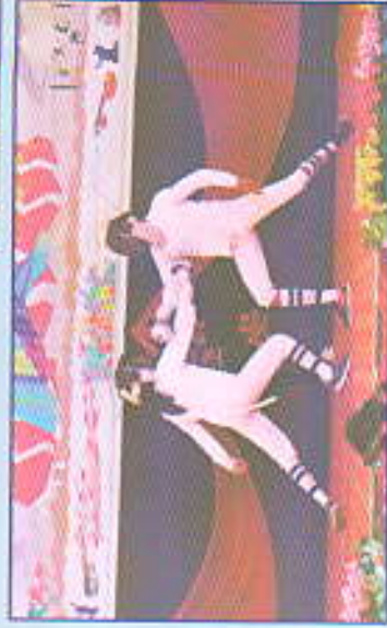
स्पेक्ट्रम - २०१९