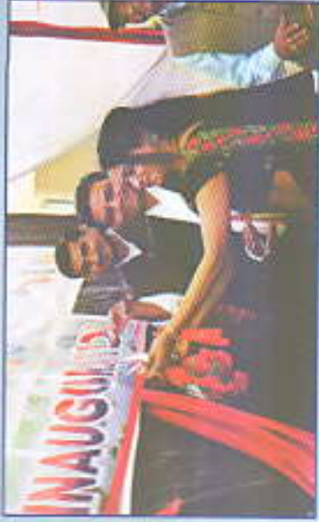
स्पेक्ट्रम - २०१९ चा उद्घाटन समारंभ