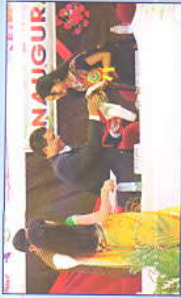
स्पेक्ट्रम - २०१९ चा उद्घाटन समारंभाची क्षणचित्रे