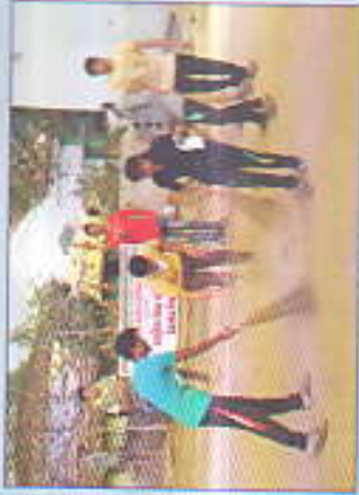
ग्राम चौक स्वच्छता