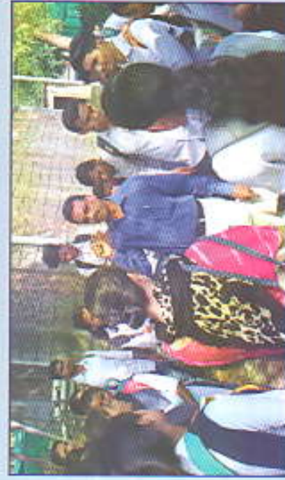
वाकडी प्रकल्पास भेट